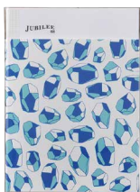
B / Kakera 生産終了