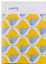
Y / Angelfish 2